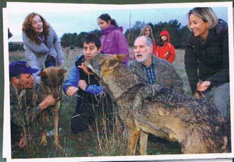
Los asistentes pudieron disfrutar junto a los lobos.

Culebra, territorio en donde los ganaderos llevan años conviviendo con el lobo gracias a que manejan el ganado como debe de hacerse, y donde los amantes del lobo podemos hacer turismo para observarlos en plena libertad, como símbolo de una cultura que convive con nosotros desde la noche de los tiempos".